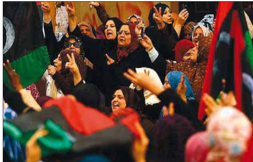
Divendres d'oració a la plaça de la Revolució.