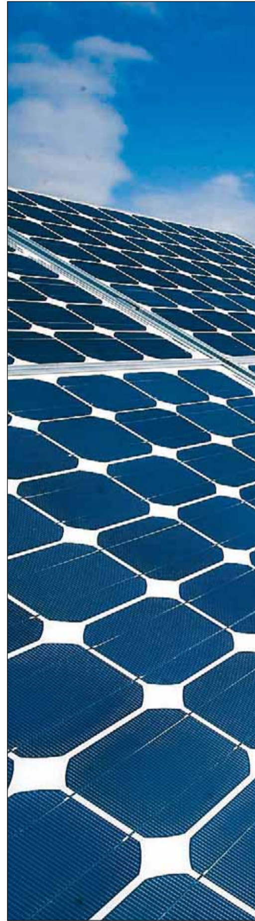
Model d'instal·lació per a l'aprofitament de l'ener-

Els ponents del fòrum plantejaran la necessitat que els governs actuïn per crear un entorn de negocis eficient i regulat d'una manera equitativa. La perspectiva no és favorable perquè la competència per als volums limitats de capital que estan disponibles es preveu dura i intensa. En qualsevol cas els països del nord de l'Àfrica no poden defugir aquest dilema si volen estimular la diversificació econòmica i el creixement de l'ocupació que necessiten per mantenir l'estabilitat política i social.