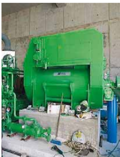
Caldera en una planta de reciclatge.

Davant d'això, en els últims anys s'han incrementat les bioconstruccions, les energies renovables, les dessalinitzad-