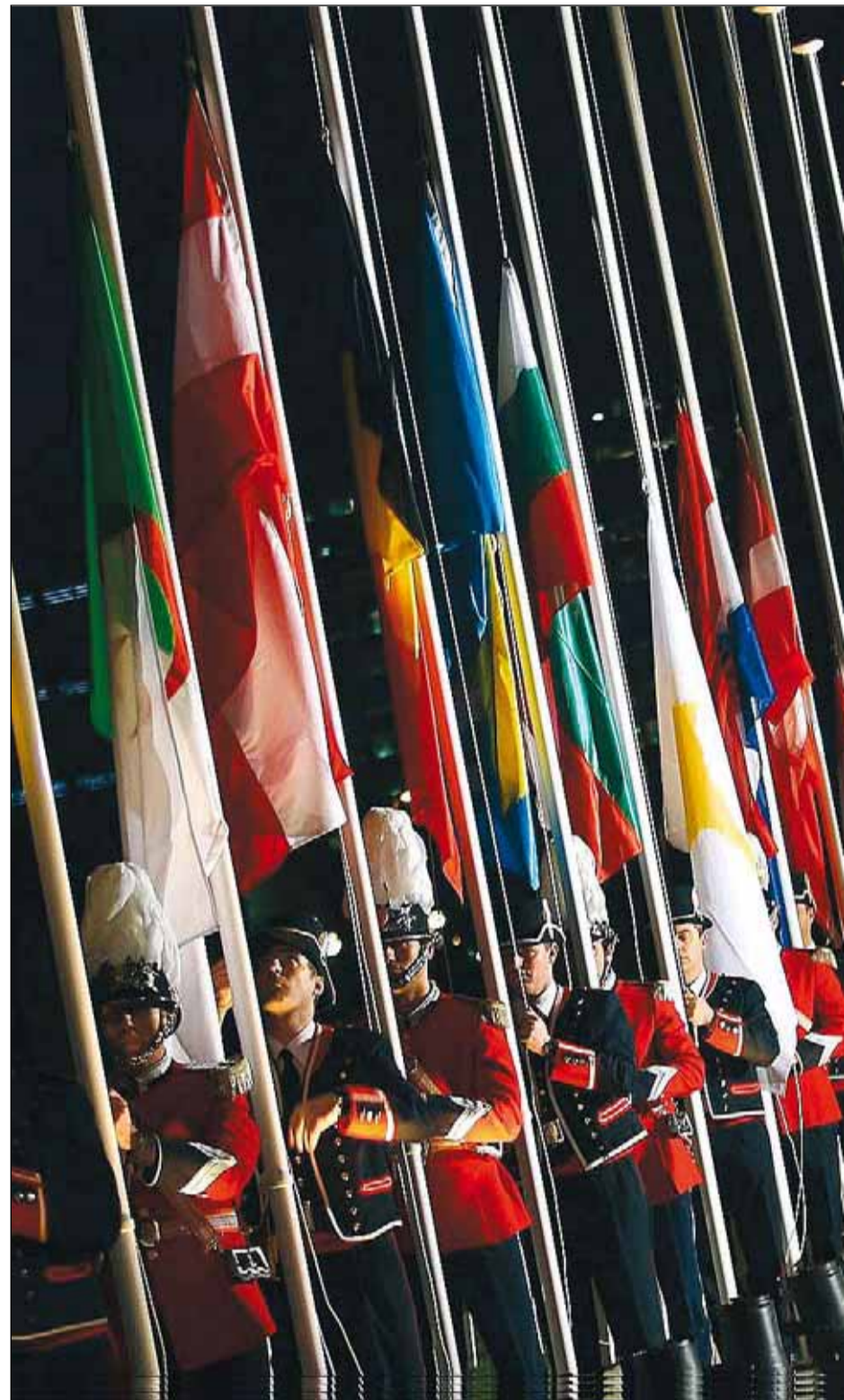
Hissada de banderes durant la inauguració de la seu de la secretaria de la Unió pel Medi