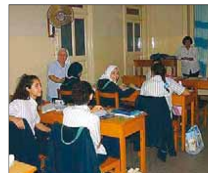
Nenes en una escola egípcia.

En moltes ocasions, aquests aspectes estan modelats per la influència de la legislació, però en altres són la religió, l'educació o, simplement, la tradició, els que imposen les seves regles i fan que es mantinguin els principis d'autoritat, jerarquia i submissió de lleis patriarcals ancestrals. Aquestes normes són ente-