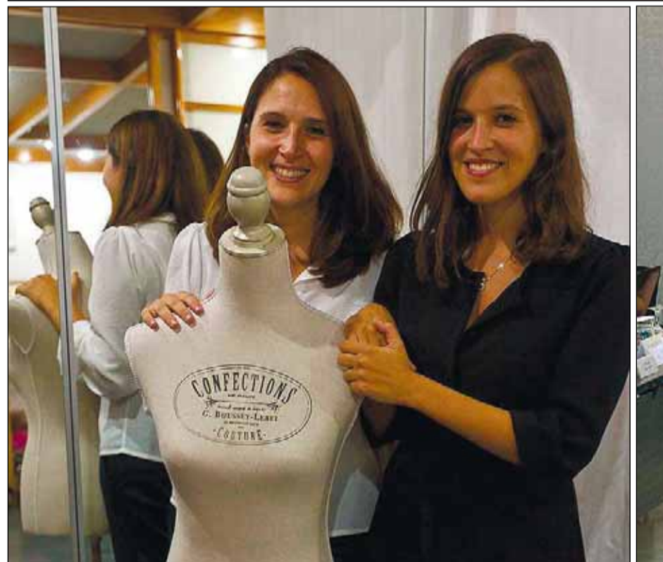
A dalt a l'esquerra, participants en el Meda Women Entrepreneurs Forum del 2009. A dalt a la dreta, dues dones treballant amb un maniquí.

dels actuals graduats universitaris siguin dones, que tenen qualificacions lleugerament superiors a les dels homes”, anota De Felipe. Per tant, “les nostres economies no haurien de permetre's el luxe de perdre tot aquest talent” , com desgraciadament està passant.