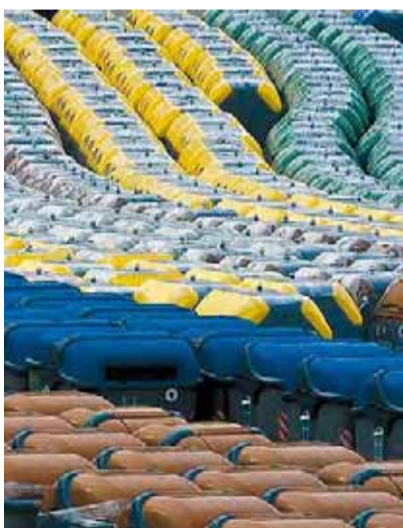
Contenidors de recollida selectiva.

al 40% de recollida selectiva dels residus municipals, a més de ser el territori on més intensament s'ha desplegat la recollida de la fracció orgànica. A més a més, la indústria compta amb un alt aprofitament dels residus que genera, i per tant es pot convertir en un referent aprofundint en noves oportunitats de negoci. "El sector empresarial té una oportunitat de primer ordre per vendre capacitat tecnològica i operativa. El mercat del sud del Mediterrani té un gran potencial per a les nostres més de 800 empreses. Per aquest motiu, des del Govern volem impulsar la seva capacitat d'internacionalització", afegeix el director de l'ARC. ◉