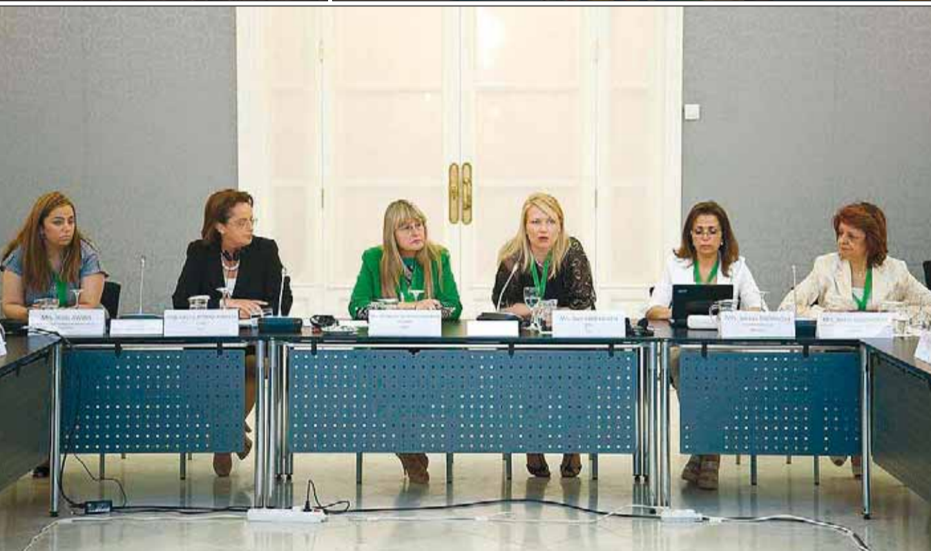
dreta i a sota a l'esquerra, diverses emprenedores. A sota a la dreta, dones de l'Anima Investment Network.