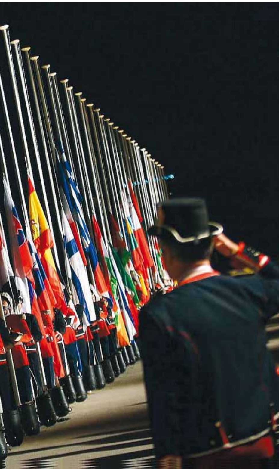
terrani al palau de Pedrables, el març del 2010.