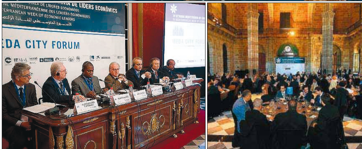
Diversos moments de l'última edició de la Setmana Mediterrània de Líders Econòmics.

però que també consolida Barcelona com a capital econòmica del Mediterrani.