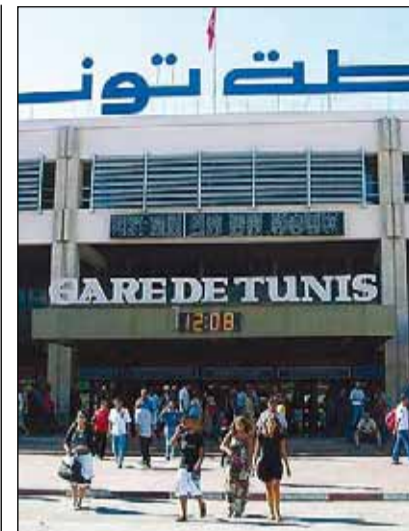
Estació central de Tunis.