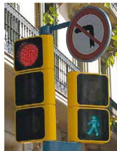
Semàfors amb leds a Barcelona.

Hi ha tecnologies de baix cost i això suposa una oportunitat per als països del nord d'Àfrica, que poden basar el desen-